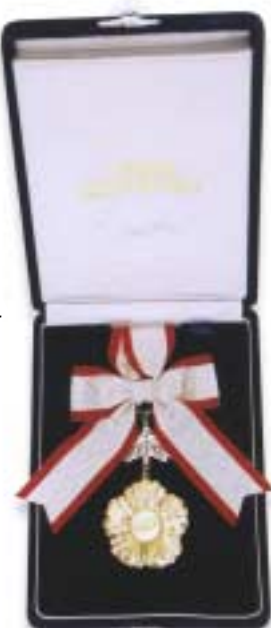
The Fukuoka Asian Culture Prize Medal

JAPAN The Fukuoka Asian Culture LETTER Prizes were established in 1990 in order to maintain and foster Asian culture and promote the recogni-