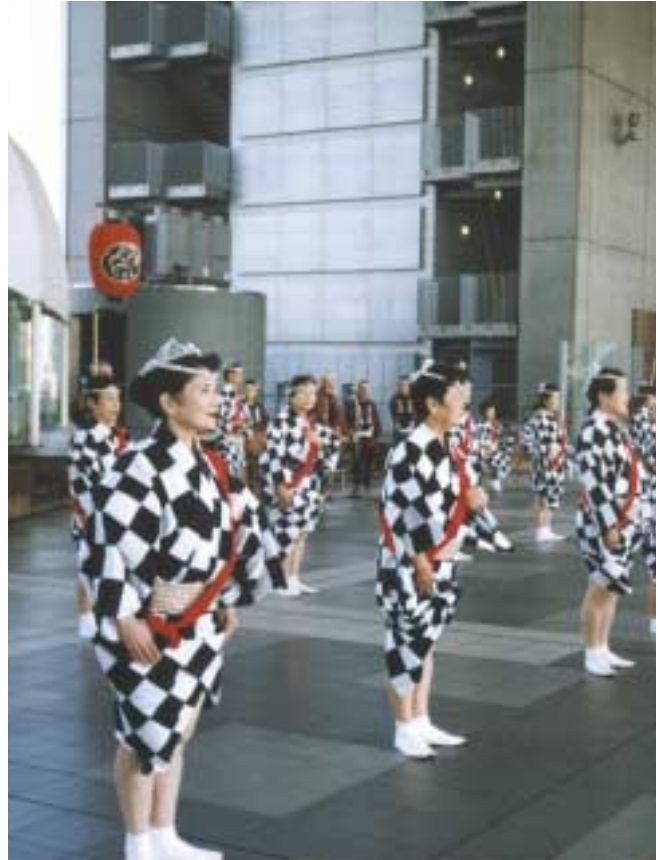
Performing Japanese dance at the Edo museum in Tokyo.

The next morning (13 Nov.2000) we followed the sightseeing program in Kyoto, the first visit on the route is the Roku-onji Temple but it was regrettable to skip entry into the main hall because it was under repair. After that we visited Shogun's Castle owned by the powerful ruling clan of Tokugawa. Leaving the Castle we entered a Japanese-style restaurant nearby named Shinsen-en