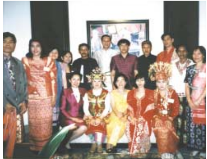
Joining farewell party in Tokyo.

Apart from visits to the schools, other culturally resourceful