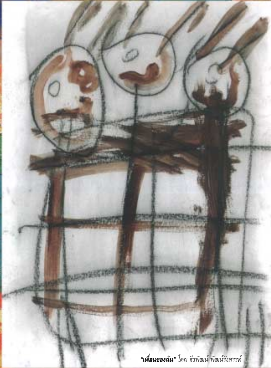
“เพื่อนของฉัน” โดย ชีรพัฒน์ พัฒนรังสรรค์

If we could choose the circumstances in which we are born, most of us would choose to be born with money and in good health, but nature has not allowed us the gift of choice. Instead, we are all born different.