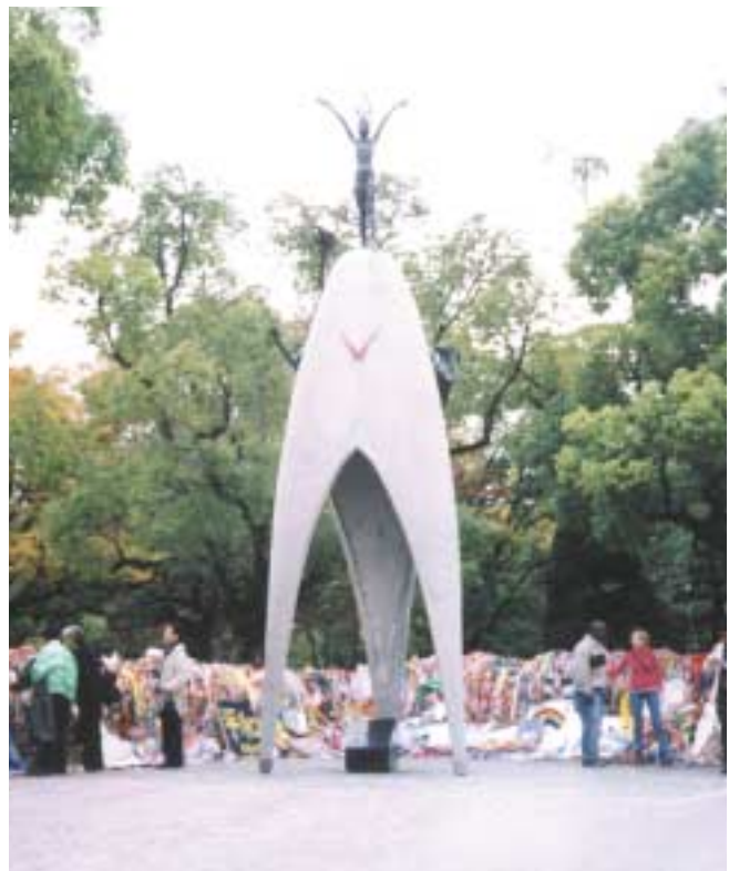
Children Peace Monument in Hiroshima.