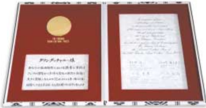
The Diploma of Honor bound in traditional Hakata obi material

tion of its value with a view to instituting a basic framework for mutual learning and active interaction among Asian people. The awardees are to be selected among individuals or organizations that have made outstanding contributions to preserving and creating unique and diverse cultures in Asia.